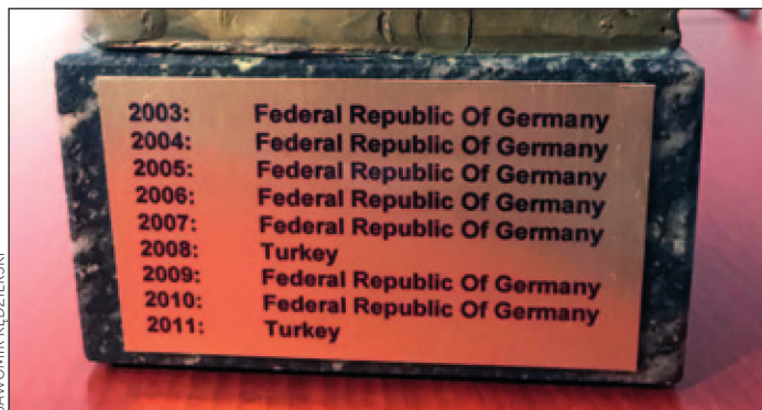
Tabliczki z uwiecznionymi drużynowymi zwycięzcami NATO Chess